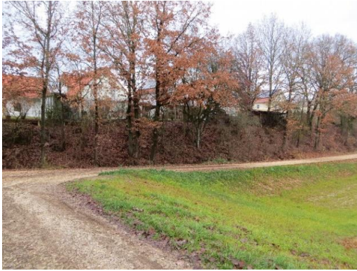
Eichenranken am Eheweg

Das Regenrückhaltebecken ist neu angelegt, wird noch stabilisiert und durch eine wirksame Begrünung in die Umgebung eingebunden.