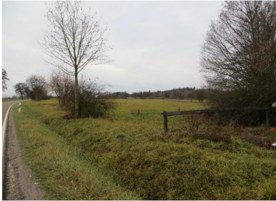
Grünland hinter Feldhecke