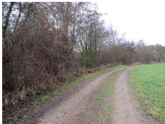
Feldweg mit Feldhecke im SW

Entlang des westlichen Randes verläuft ein Feld- und Wanderweg hinter dem im Südwesten eine Feldhecke und im Nordwesten ein Gehölz- und Feuchtlebensraum mit einem Teich anschließen.