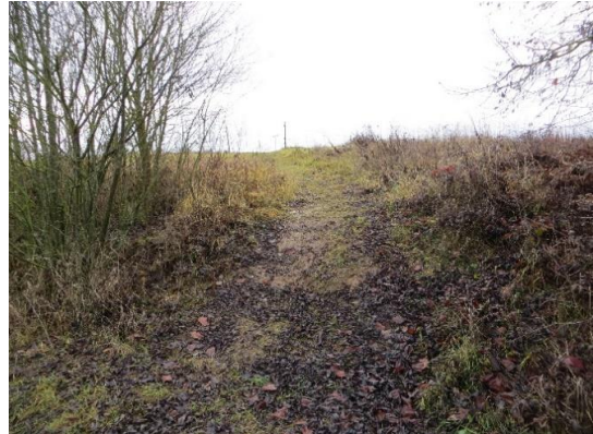
Pfad vom Weg zur Koppel

Der Gehölz- und Feuchtlebensraum mit einem Teich im Nordwesten hat sich aus einer teilweisen wiederverfüllten Abbaufäche entwickelt. Er umfasst Sukzessionsflächen unterschiedlicher Stadien – überwiegend lichter Laubholzbestand mit Überhältern (Birken, Eschen, Hainbuchen) über vergreisenden Weidengehölzen, Randbereichen, einer inselartigen Freifläche, viel Totholz, Rohbodenstandorten trockener und feuchter Ausprägung, benachbarter Seefläche, Gräben und Feuchtbereichen etc. Terrassierte und spornartige Geländeauffüllungen weichen hier vom natürlichen Geländeverlauf ab und verursachen dadurch Auffüllböschungen im Übergangsbereich zur angrenzenden Feldflur bzw. zur geplanten Bebauung.