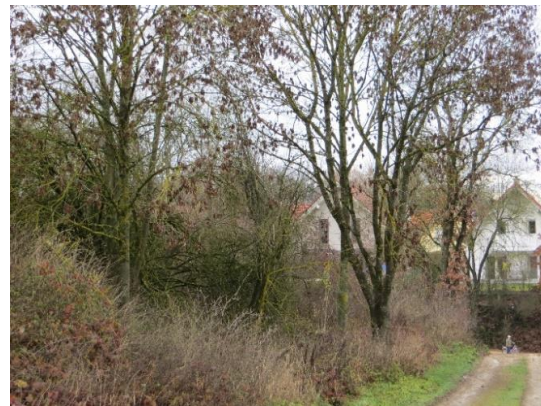
Feldweg im NW

Die Feldhecke im Südwesten besteht aus heimischen Gehölzen wie Eiche, Hainbuche, Pappel, Ahorn, Hasel, Liguster, Weißdorn oder Hartriegel, verläuft zunächst auf einem kleinen Wall und geht schließlich in eine Böschungshecke über. Dahinter liegen Grünlandflächen (derzeit Nutzung als Pferdekoppel) und eine Deponie. Die Hecke schirmt die geplante Baufläche bereits zum jetzigen Zeitraum wirksam nach Westen ab und bildet so einen vorgezogenen Ortsrand.