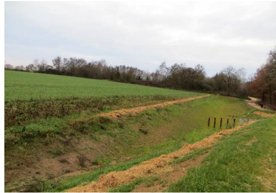
RRB nördlich der geplanten Baugebietsfläche

Entlang des westlichen Randes verläuft ein Feld- und Wanderweg hinter dem im Südwesten eine Feldhecke und im Nordwesten ein Gehölz- und Feuchtlebensraum mit einem Teich anschließen.