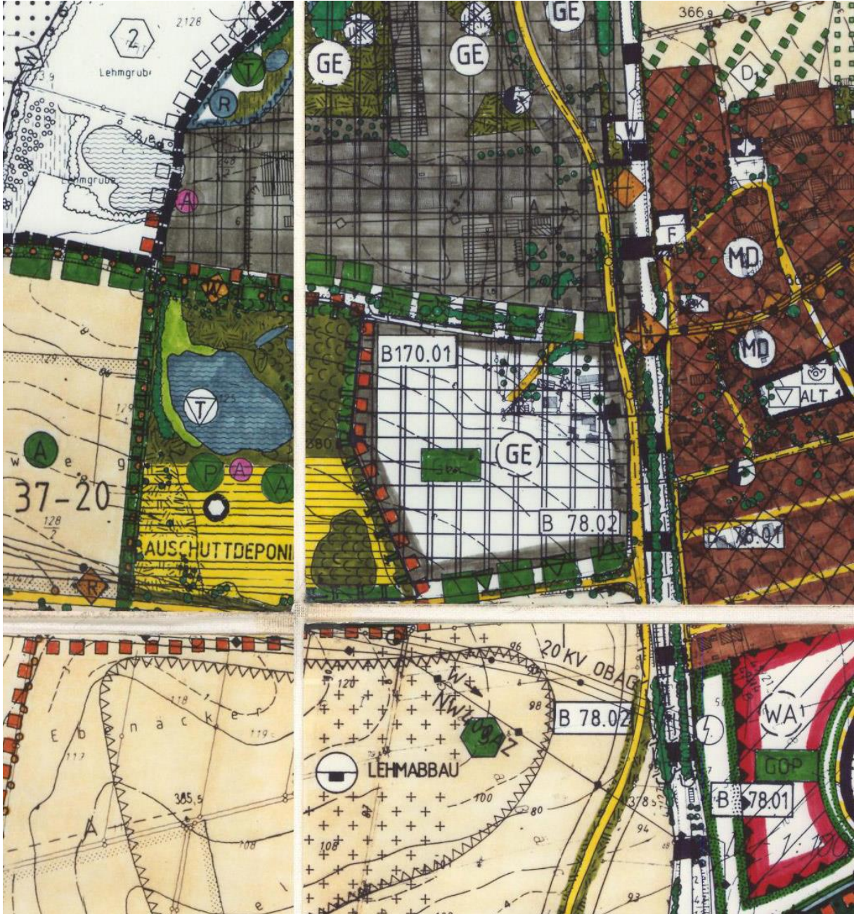
FNP vom 12.06.1996