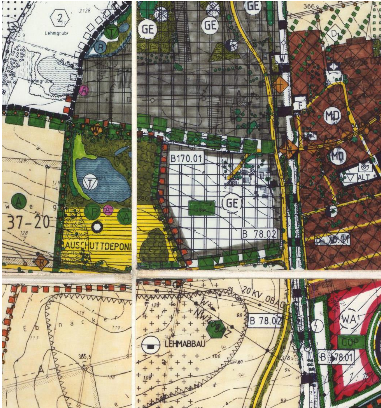
FNP vom 12.06.1996